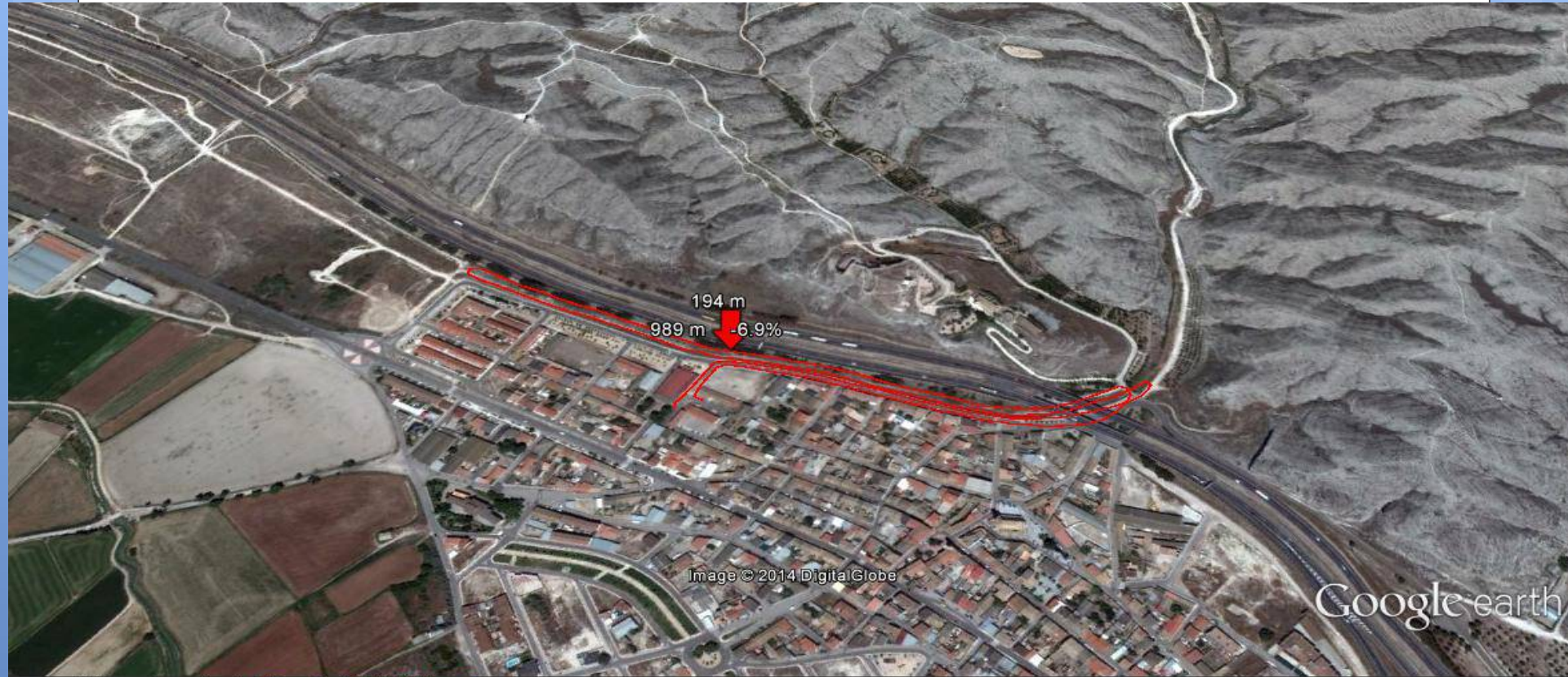
Gráfico: min., media, máx. Elevación: 191, 197, 204 m Total de intervalo: Distancia: 2.75 km Incremento/pérdida de elevación: 30.6 m, -30.7 m Pendiente máxima: 8.7%, -9.8% Pendiente media: 2.1%, -2.2%