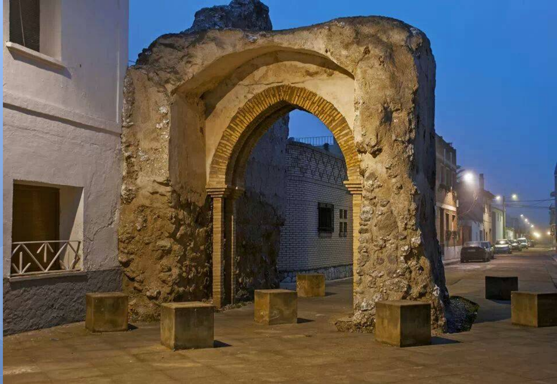
Salida desde La Portaza