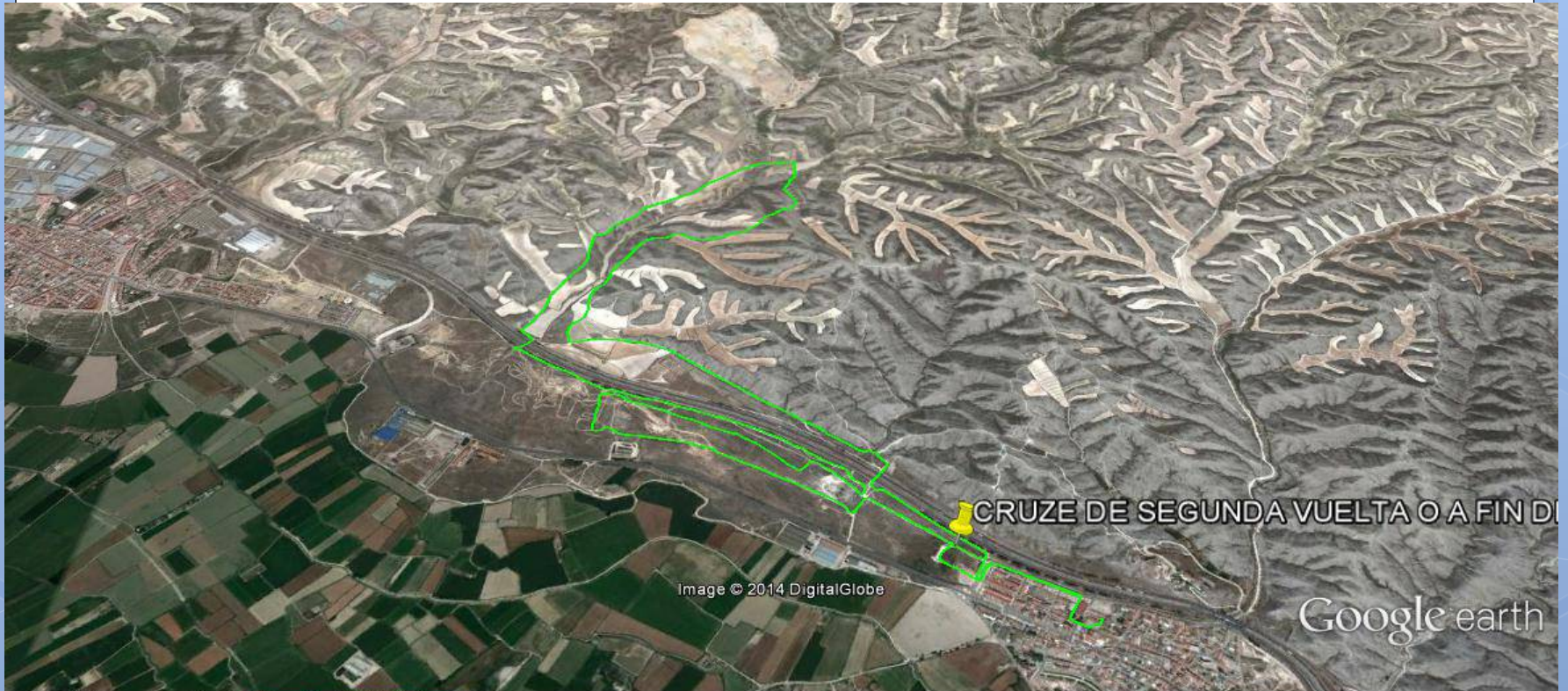
Gráfico: min., media, máx. Elevación: 188, 207, 251 m Total de intervalo: Distancia: 10.8 km Incremento/pérdida de elevación: 124 m, -123 m Pendiente máxima: 11.9%, -8.5% Pendiente media: 2.2%, -2.0%